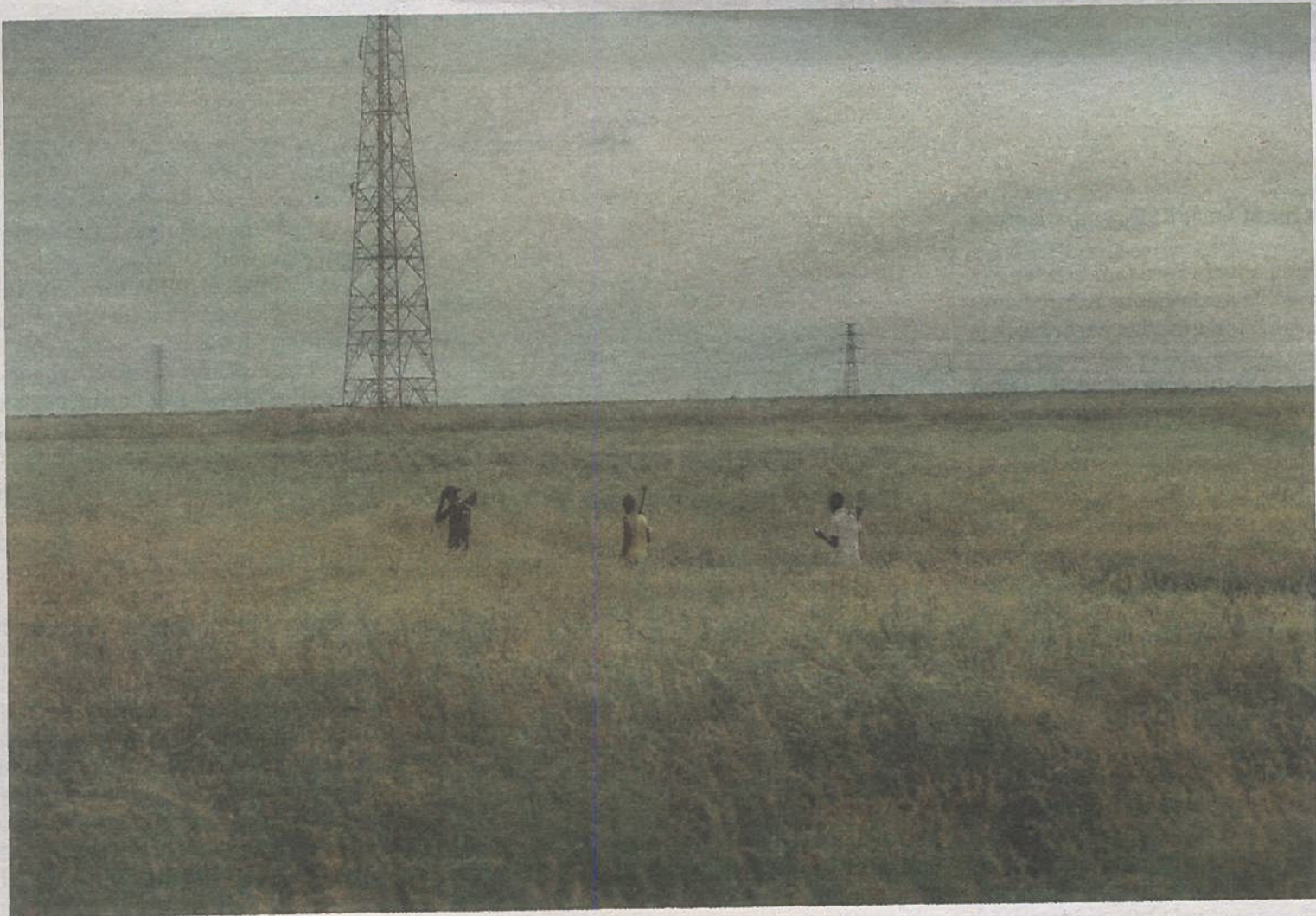
Ud over flygtninge bor der ganske få mennesker i grænseområdet mellem Sydsudan og Sudan