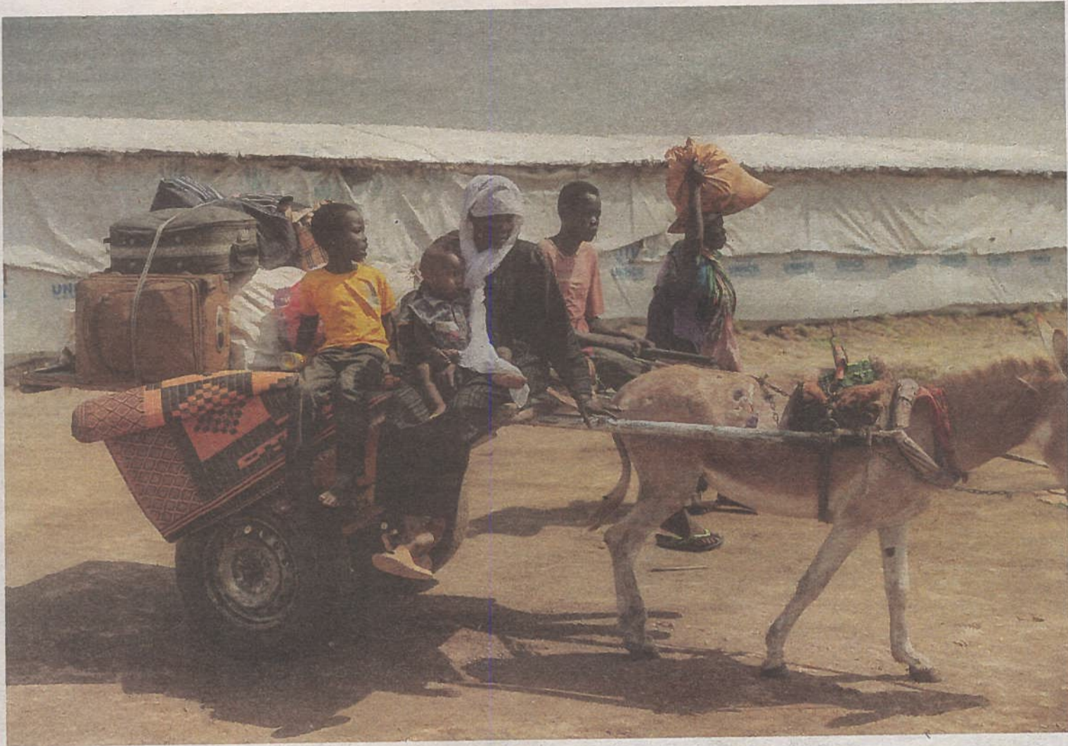
30-årige Ading Atak Gum ankommer til Sydsudan med sin mand og fem børn efter at være flygtet fra Khartoum