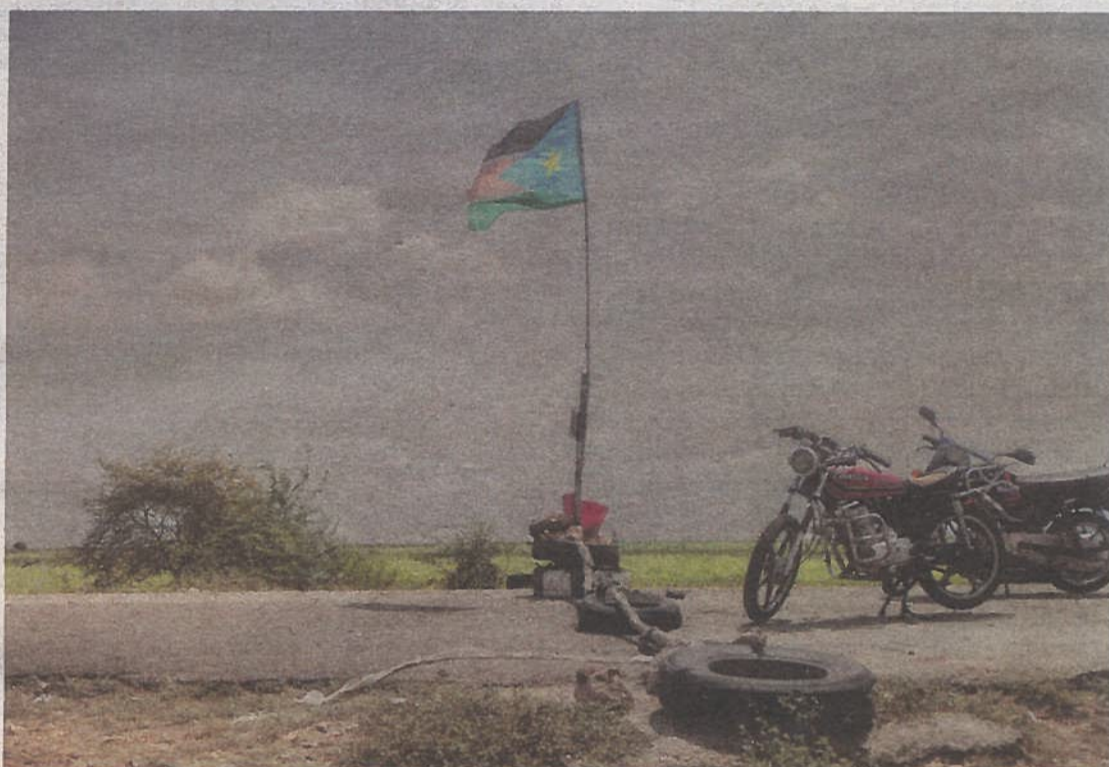
På grænsen til Sudan hænger det sydsudanske flag. Sort symboliserer folket, rød er frihedskæmpernes blod, grøn er landets naturressourcer, blå er Nilens farve, og den gule stjerne står for national enhed

jorden, indtil han fandt hjælp, og nogle uger senere flygtede han mod syd på ryggen af sin tvillingebror, i busser og på æselkærter.