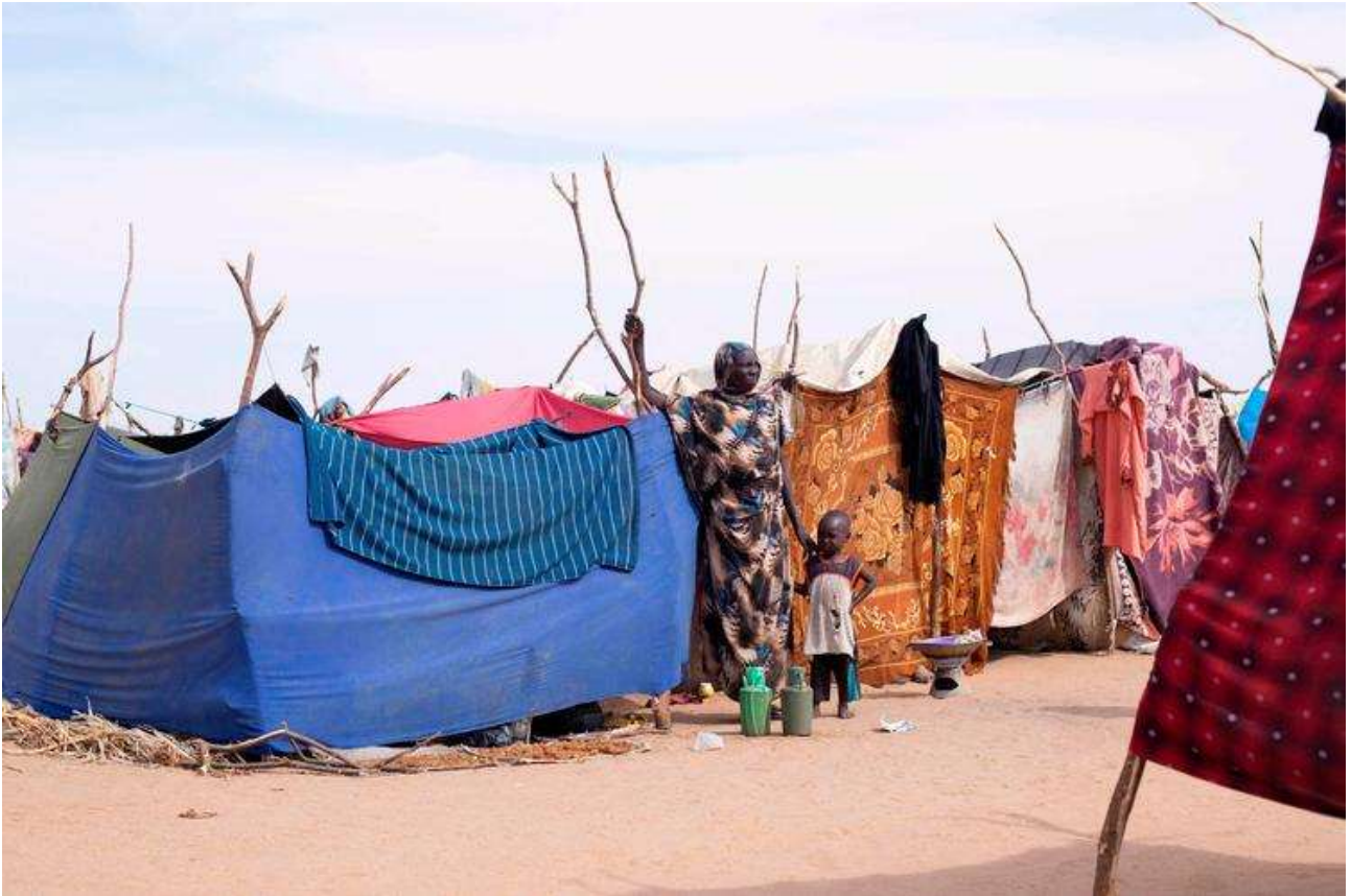
En fordrevet sudanesisk kvinde og hendes barn står blandt telte efter at være flygtet fra El-Fasher efter byen blev erobret af Rapid Support Forces (RSF)