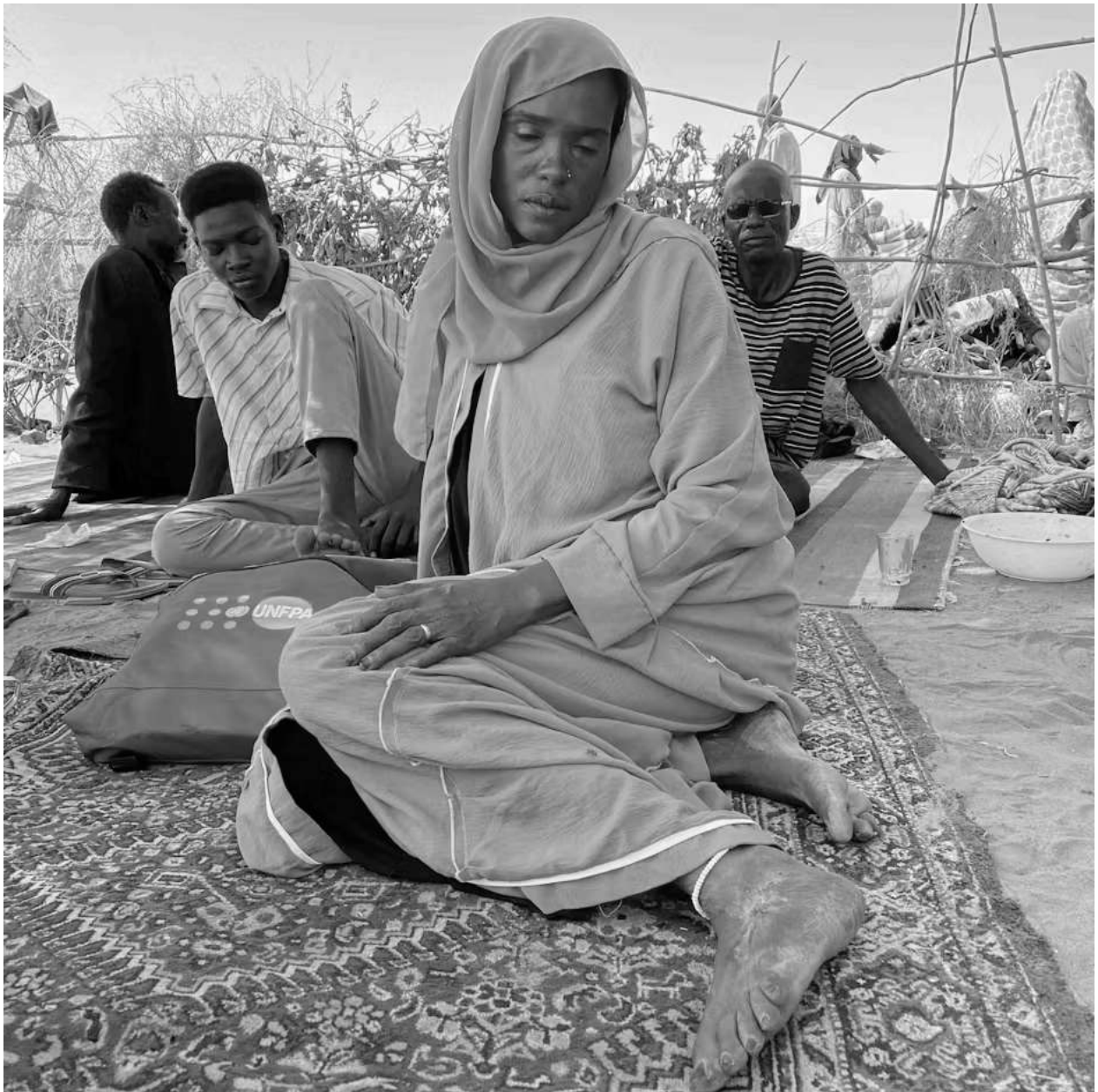
Kvinden her er flygtet fra El Fasher efter RSF tog kontrol over byen. Hun flygtede til Tawila-lejren. Billedet er fra 30. oktober 2025.