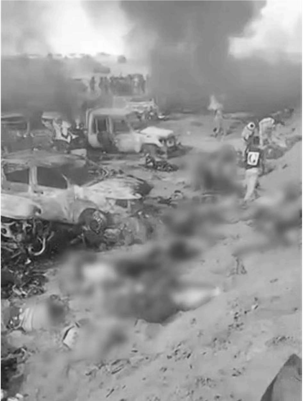
Reuters har lokaliseret billeder af, hvad der ligner en massakre nær byen El Fasher.

viser et svedent område og afbrændte biler på det sted, hvor videoerne blev optaget – noget, der ikke var til stede på billeder fra 26. oktober.