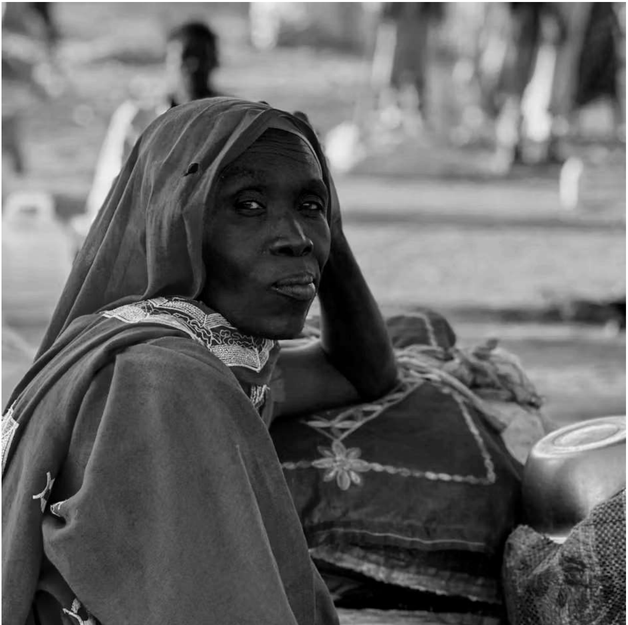
En fordreven kvinde fra El Fasher, der er flygtet til en lejr i byen Tawila. Billedet er fra 28. oktober.

- RSF vil ikke integreres i regeringshæren, som ellers var planen. Det vil nemlig betyde tab af status, magt og ikke mindst rigdom. RSF har snablen langt nede i Sudans guldminer. Krigen handler om mange ting; etnicitet, magt og rigdom blandt andet, siger Ole Vestergaard.